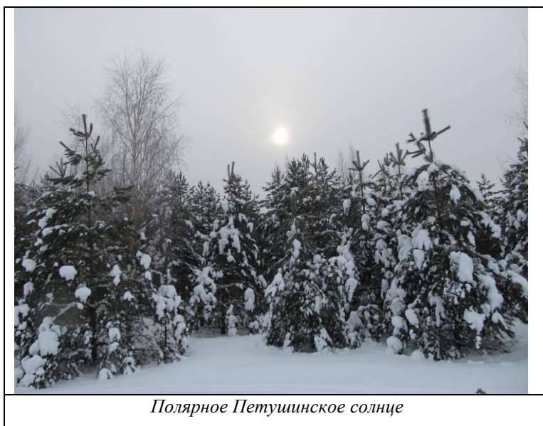
Полярное Петушинское солнце

В путь! Выбравшись из жилого массива, попадаем сначала в невысокую елочную аллею, а затем в более старый, красивейший хвойный лес. Костер обещает быть хорошим =)